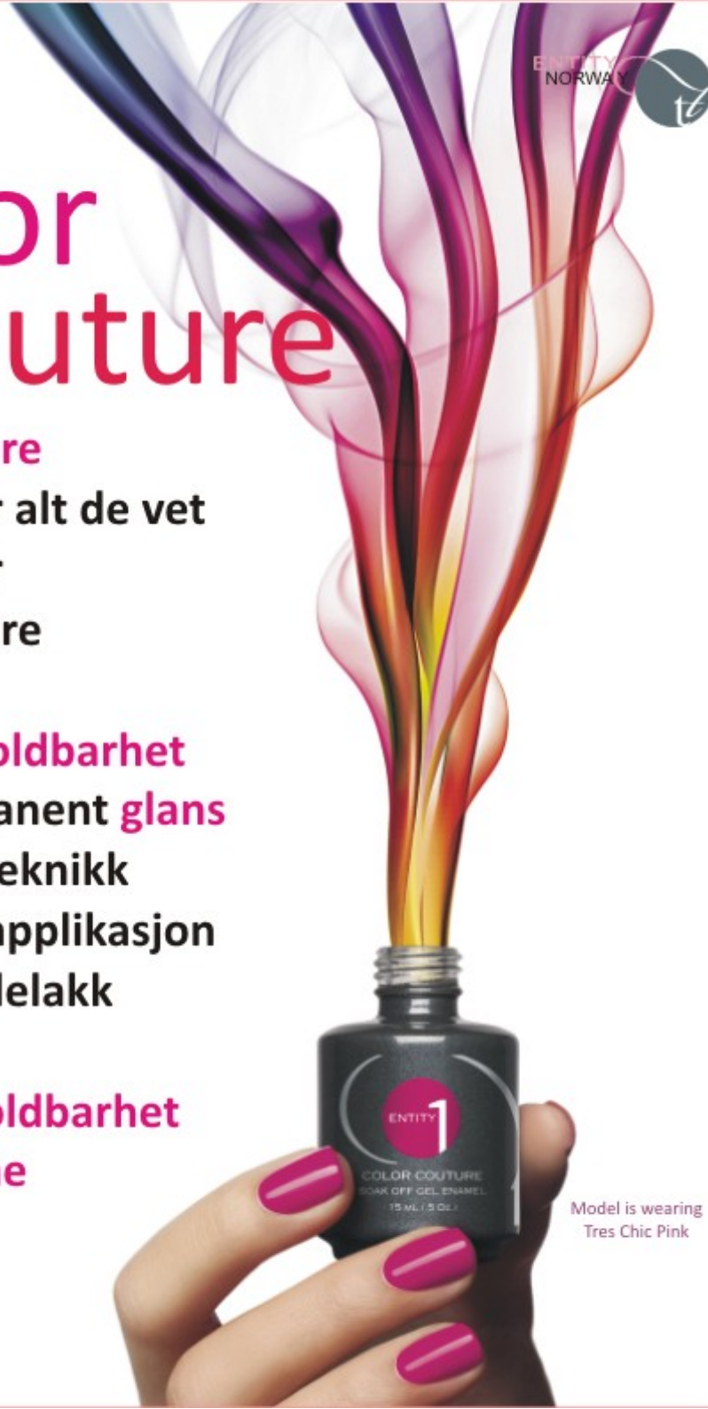
Model is wearing Tres Chic Pink